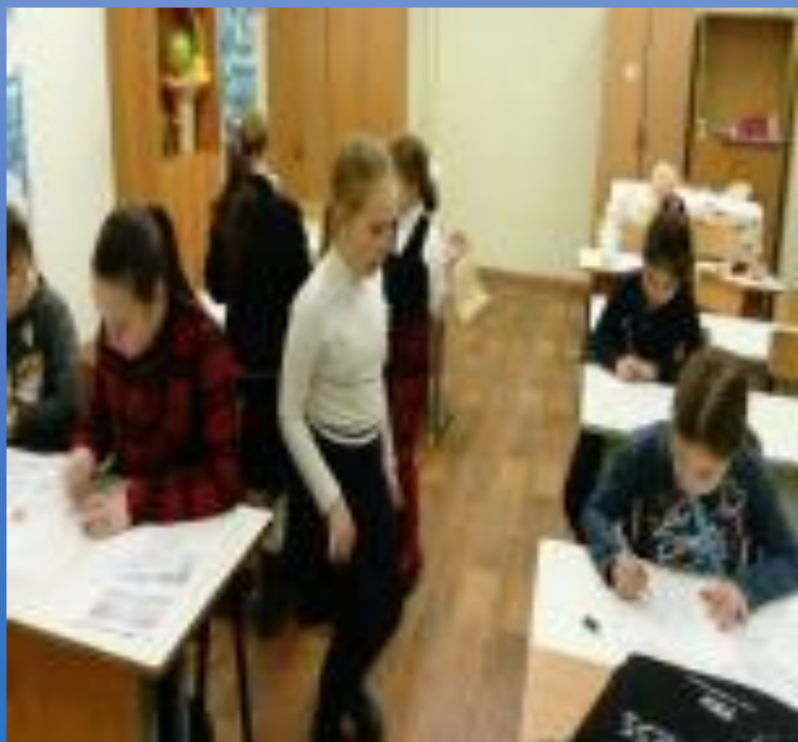
В творческом порыве.....