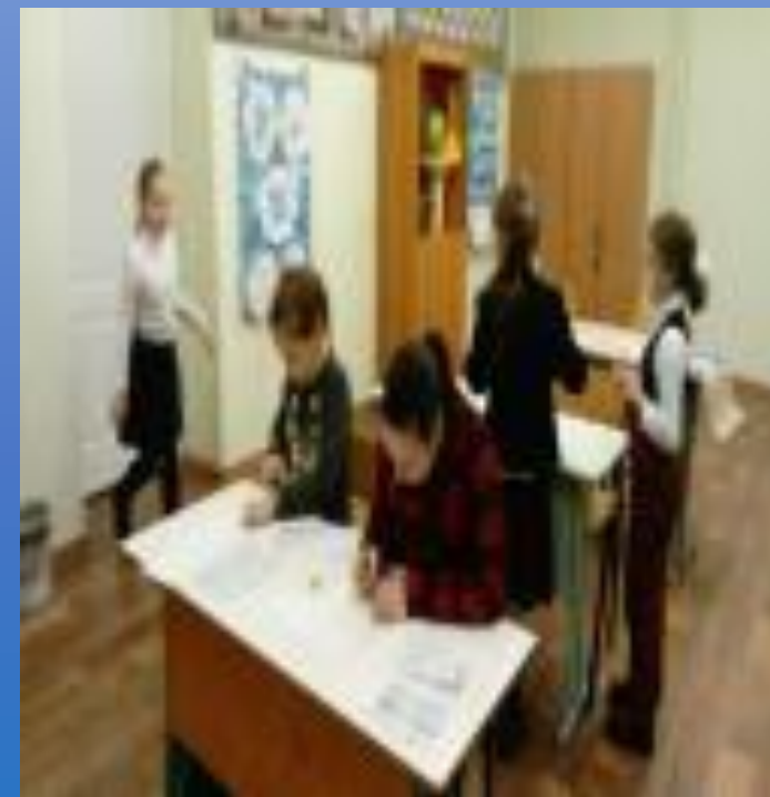
Выбираем тип линии штриховки...